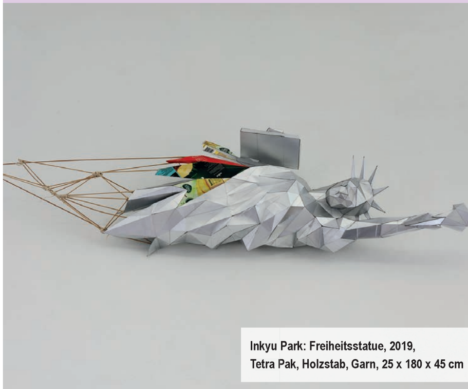
Inkyu Park: Freiheitsstatue, 2019, Tetra Pak, Holzstab, Garn, 25 x 180 x 45 cm